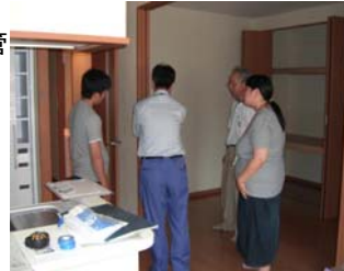
最後に指摘箇所の 説明状況