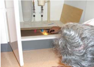
・洗面化粧台 点検口から見えること 配管の接続状況 床下の状況