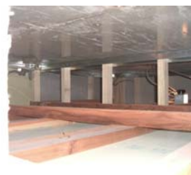
間仕切や天井の 木下地の状況 コンクリートの状況