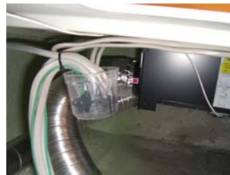
配線の 接続箇所の状況