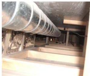
換気ダクトの 配管状況