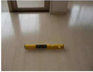
床の水平度 のチェック