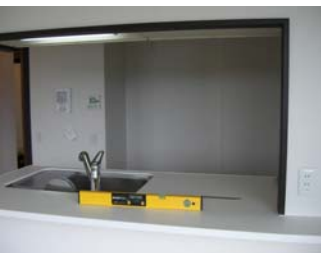
デジタル水平器 キッチンカウンター 水平度のチェック