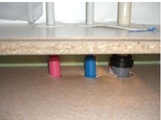
配管と床の取り合い 配管用切込みが 広すぎる