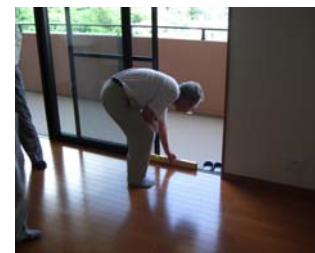
サッシの水平度 のチェック