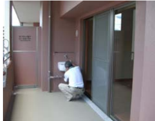
ベランダSKの配管 の点検状況