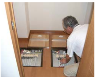
・配管接続用点検口 配管の施工状況 床の掃除